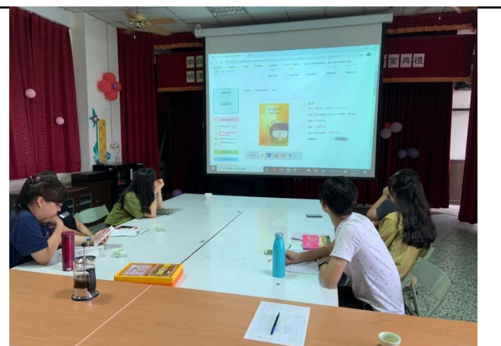
圖卡在課程設計上的運用