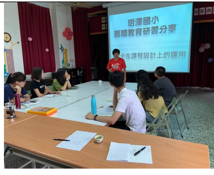
親職教育研習分享