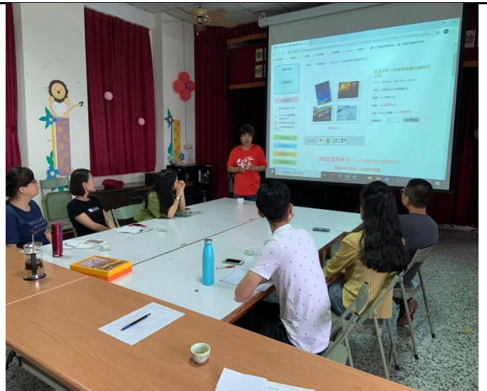
親職教育影片分享